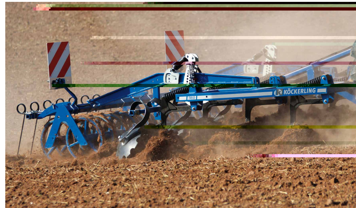
Trio 300 Med dobbelt STS valse Jævnnetallerkner og Stensikring

Som ekstraudstyr kan Trio Harven udstyres med Dobbelthjæret stensikring, Hydraulisk dybderegulering og jævnnetallerkner.