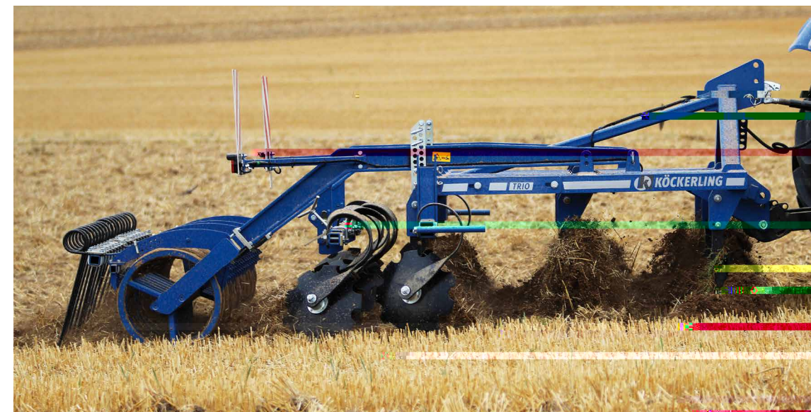
Trio 300 Med STS valse Jævnnetallerkner uden stensikring

Som ekstraudstyr kan Trio Harven udstyres med Dobbelthjæret stensikring, Hydraulisk dybderegulering og jævnnetallerkner.